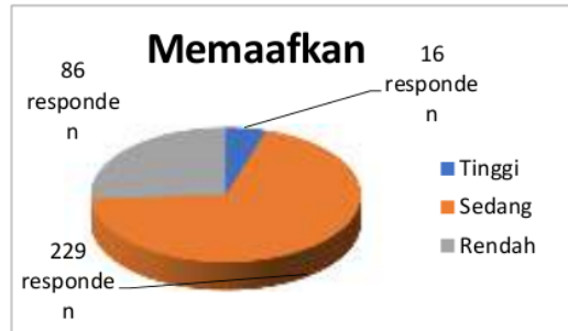
Gambar 2. Diagram Memaafkan

41, Mean (M) 52,53, dan Standar Deviasi 4.781. Untuk melihat responden yang memiliki nilai tinggi, sedang dan rendah. Maka untuk melihat nilai tersebut dapat diketahui dari gambar 2.